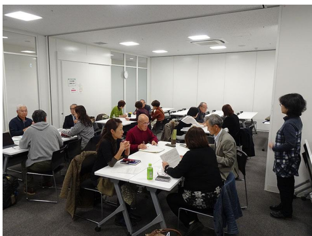
柏市民活動講座「助成金申請のポイント」

また、市民活動団体の活動を可視化、価値化して多くの共感と支援を得るために、インターネットを活用した活動情報の発信についても講義していただきました。