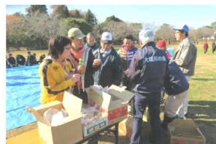
11:30 おにぎりとお茶の配布

ゲームの賞品は地元農家の皆さんから提供された新鮮野菜でしたが、“ビンゴ”の余興も楽しく、商品が配られる度に大喜びです。きっと、来年の統一クリーンディも大いに盛り上がることでしょう。