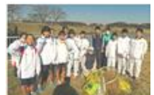
「道の駅 しょうなん」の皆さん