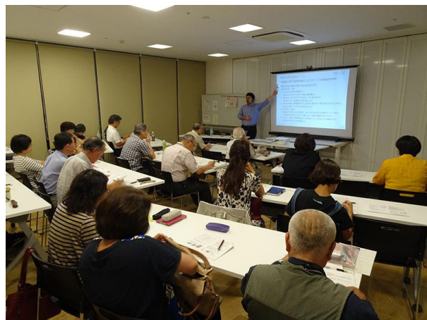
柏市民活動講座「助成金を活用して活動を広げよう」