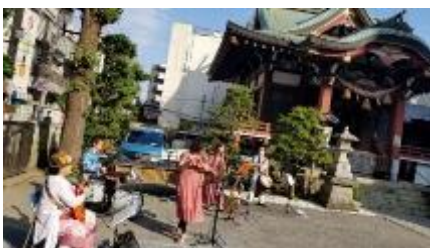
かしわファミフェス（柏神社コンサート）