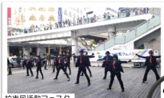
柏市民活動フェスタ

残念ながら、柏のイベントを代表する柏まつりと手賀沼花火大会は今年も中止になりましたが、来年こそは、イベント全開で柏を盛り上げたいものです。