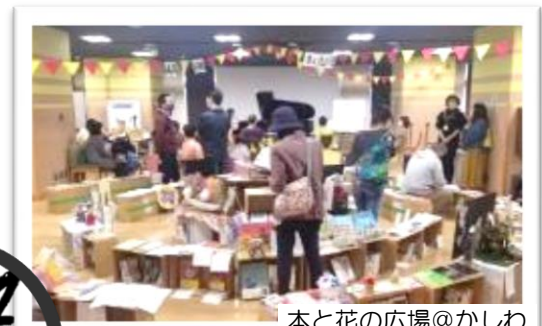
本と花の広場@かしわ