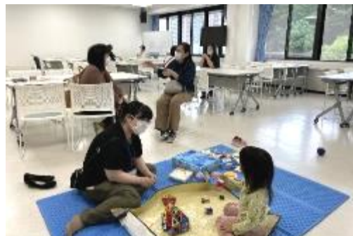
「ゆるりこ」の様子 2022年6月7日（会場 ラコルタ柏）