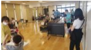
市民活動フェスタ（楽器体験 in パレット柏）