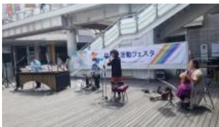
市民活動フェスタ（ファミリかしわ前広場コンサート）